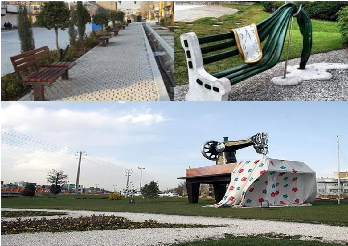
شکل (۲): نمونه مبلمان شهری در شهر کرج