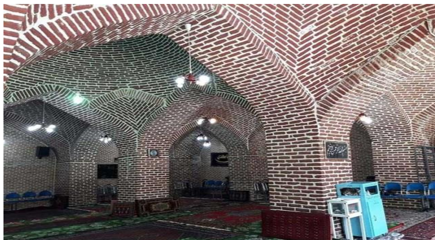
تصویر (۲): جاهای دیدنی میاندوآب آذربایجان غربی

مسجد طاق: مسجد طاق در کوچه طاق، خیابان ۱۷ شهریور شهر میاندوآب واقع شده است. این مسجد زیبا متعلق به اواسط دوره قاجار است و به نظر می رسد در فاصله بین سال های ۱۲۰۰ تا ۱۲۱۰ ه.ق ساخته شده که در این بین سال ۱۲۰۲ محتمل تر است. سازنده بنا حاکم مراغه، احمدخان بیگلر بیگی، بوده که پیوند خویشاوندی نزدیکی با فتحعلی شاه قاجار داشته است. مسجد طاق که قدیمی ترین مسجد شهر میاندوآب است ترکیبی از سنگ، آجر و خشت است و آجرهای قرمز رنگ آن جلوه خاصی به بنا داده اند.