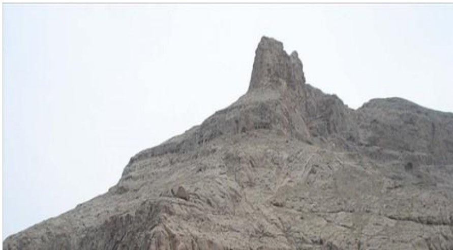
تصویر (۱): جاهای دیدنی میاندوآب آذربایجان غربی

مسجد طاق: مسجد طاق در کوچه طاق، خیابان ۱۷ شهریور شهر میاندوآب واقع شده است. این مسجد زیبا متعلق به اواسط دوره قاجار است و به نظر می رسد در فاصله بین سال های ۱۲۰۰ تا ۱۲۱۰ ه.ق ساخته شده که در این بین سال ۱۲۰۲ محتمل تر است. سازنده بنا حاکم مراغه، احمدخان بیگلر بیگی، بوده که پیوند خویشاوندی نزدیکی با فتحعلی شاه قاجار داشته است. مسجد طاق که قدیمی ترین مسجد شهر میاندوآب است ترکیبی از سنگ، آجر و خشت است و آجرهای قرمز رنگ آن جلوه خاصی به بنا داده اند.