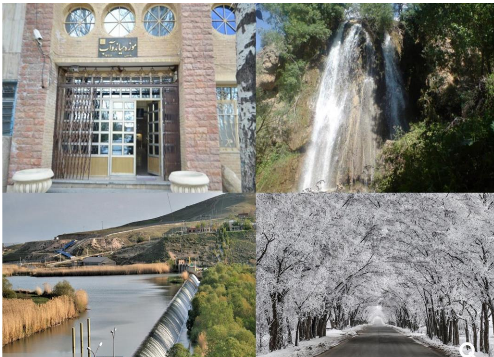
تصویر (۳): تصاویری از جاذبه های گردشگری شهرستان میاندوآب

سد نوروزلو: سد نوروزلو در سال ۱۳۴۶ در نزدیکی روستای نوروزلو بر روی رودخانه زرینه رود ساخته گردیده است. اما این سد به علت قرارگرفتن تالاب زیبای نوروزلو در محدوده آن جلوه بسیار زیبایی دارد. سد که در ۱۵ کیلومتری میاندوآب قرار گرفته از طریق جاده میاندوآب به شاهین دژ قابل دسترسی است. تالاب نوروزلو با داشتن جنگلی انبوه از درختان کوتاه گز، سرو و نیزارهای زیبا محل زندگی پرندگان بومی و مهاجر است. سد و تالاب نوروزلو یکی از تفرجگاه های زیبای شهر میاندوآب است.