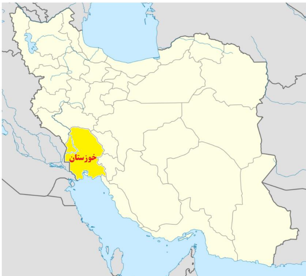
شکل (۱)، نقشه موقعیت استان خوزستان در کشور، منبع: نگارندگان، ۱۳۹۶.