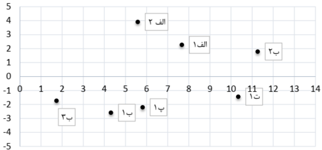
نمودار ۱- نمودار علی

نمودار علی (نمودار ۱) با توجه به زوج مرتب های (R_i + C_i, R_i - C_i) ترسیم می گردد. معیارهای که مقدار R_i - C_i آنها کمتر از صفر باشد جزء معیارهای تأثیرپذیر (معلول) و اگر بزرگ تر از صفر باشد