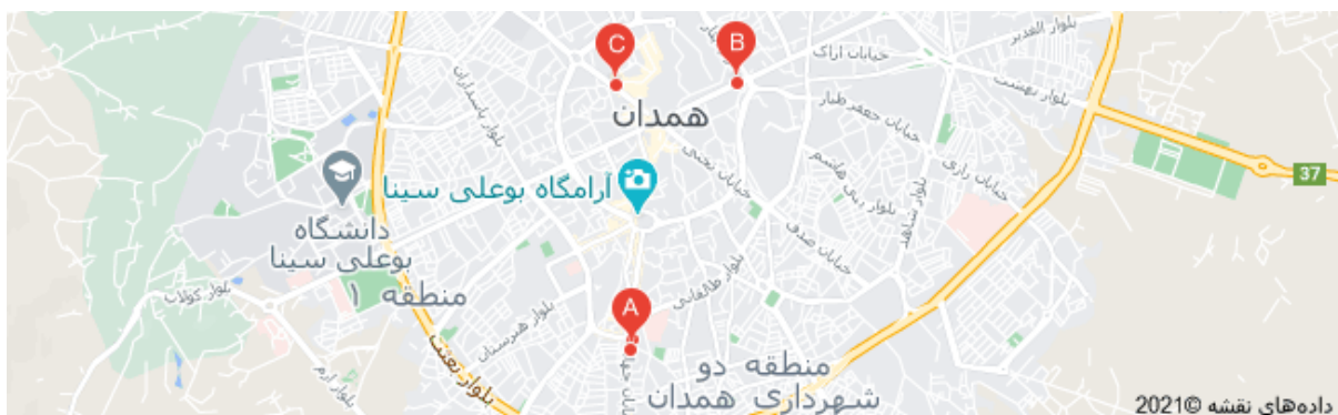
تصویر ۱: مکان شعب بانک توسعه تعاون در شهر همدان

محدوده مورد مطالعه پژوهش شهر همدان می باشد که دارای سه شعبه از بانک توسعه تعاون در این شهر است که شعبه مرکزی (سرپرستی) در میدان جهاد واقع است و دیگر شعب این بانک واقع در خیابان باباطاهر و خیابان شهدا می باشد.