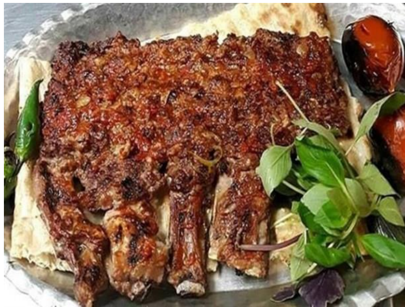
کرمانشاه شهر خلاق خوراک