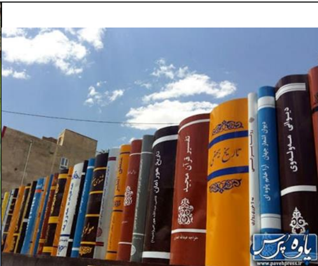
خلاقیت شهرداری پاوه کنار مسجد جامع