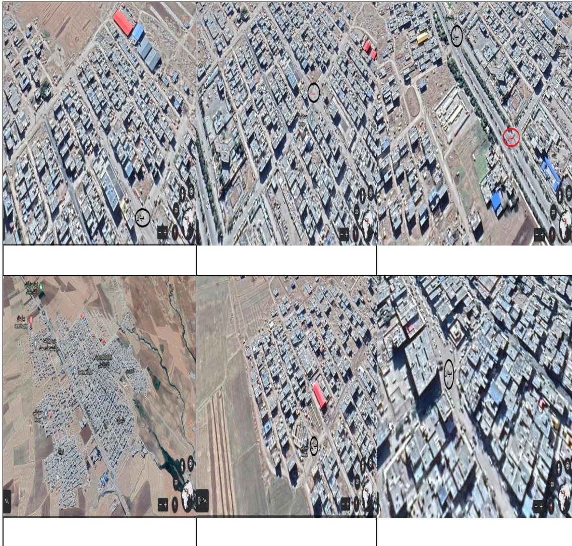
۶ میدان های پیشنهادی شهر تازه آباد ثلاث