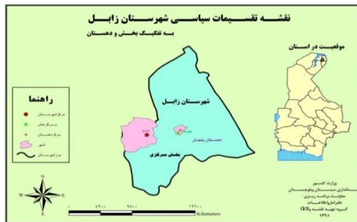
شکل ۱: تقسیمات سیاسی شهرستان زابل

( https://www.sbportal.ir/fa/cities/zabol )