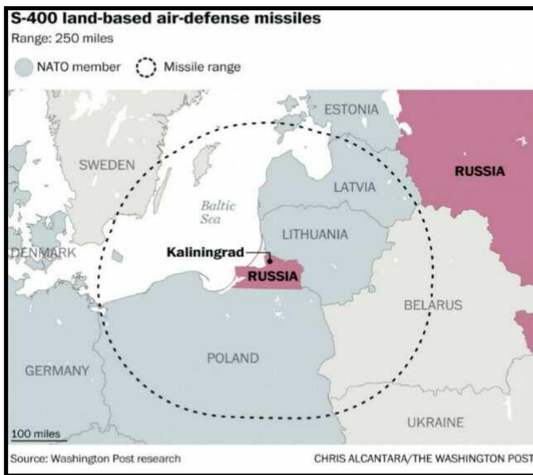
نقشه ۱: سیستم موشکی روسیه

کرمین، نگرانی های اروپایی در باره توسعه سیستم های موشکی اش در ناحیه تحت محاصره کالینگراد را با بیان این مطلب رفع کرد که سازمان پیمان آتلانتیک شمالی، تنها سازمان مختل کننده توازن و تعادل استراتژیک با طرح هایش برای برقرار کردن پدافندهای ضد موشکی در مرزهای روسیه بوده است؛ اما زراد خانه روسی در بالتیک که تعدادی از آن در سوریه تست شده است، یک تغییر دهنده بازی است. در ماه اکتبر، روسیه دفاع های ضد کشتیرانی اش را در کالینگراد با این پرتابگرها تقویت کرد. از آن به بعد، آنها را به عنوان سلاح دفاعی علیه موقعیت های شورش در سوریه استفاده کرد. موشکهای سوپر سونی از باستیون، حیطه ای تا شعاع دویست مایل دارند. در یک درگیری آنها را می توان علیه کشتی های ناتو استفاده کرد که سعی دارند به ایالت های بالتیک برسند.