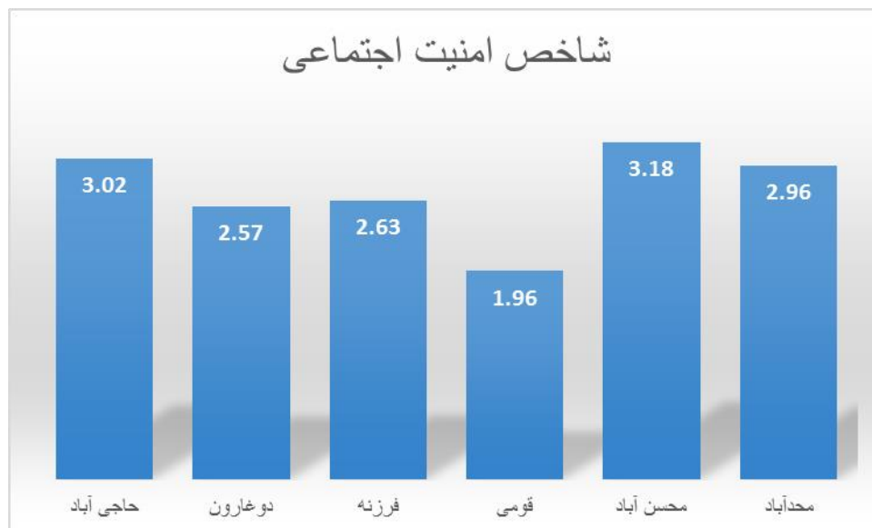
شکل ۳- نتایج سنجش شاخص های امنیت اجتماعی به تفکیک روستا

همچنین برای سنجش تفاوت میانگین ها از آمار استنباطی و آزمون T تک نمونه ای و مقدار P-Value استفاده شده است که با توجه به جدول شماره ۷ و مقدار P-Value و در شاخص امنیت اقتصادی برابر با صفر بوده و کمتر از ۰.۰۵ میباشد بنابراین فرضیه میزان رضایت امنیت اقتصادی بیشتر از متوسط است رد شده و در شاخص امنیت اجتماعی مقدار P-Value برابر با ۰.۰۰۱ بوده و کمتر از ۰.۰۵ می باشد همچنین با توجه به میانگین شاخص که برابر با ۲.۷۹ بوده بنابراین فرضیه میزان رضایت امنیت اجتماعی بیشتر از متوسط است رد شده.