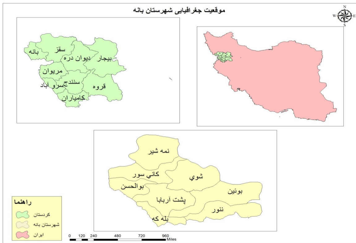
شکل ۱- معرفی منطقه ی مورد مطالعه

شهرستان بانه یکی از شهرستانهای استان کردستان است که در شمال غربی این استان واقع شده و مرکز آن شهر بانه است. این شهرستان دارای ۴ شهر به نامهای بانه، آرمرده، کانی سور و بویین سفلی است. همچنین شهرستان بانه دارای ۴ بخش، ۸ دهستان و ۱۹۲ آبادی دارای سکنه و ۲۲ آبادی خالی از سکنه است. در آبان ۱۳۹۵، جمعیت شهرستان ۱۵۸۶۹۰ نفر بوده است. از این تعداد ۱۱۵۳۲۵ نفر ساکن در نقاط شهری، ۴۳۳۶۵ نفر ساکن در نقاط روستایی بوده اند. میزان روستائیشینی در این شهرستان ۲۷/۳۳ درصد می باشد. که نسبت به سرشماری سال ۱۳۹۰ کاهش معادل ۴/۵۵ داشته است