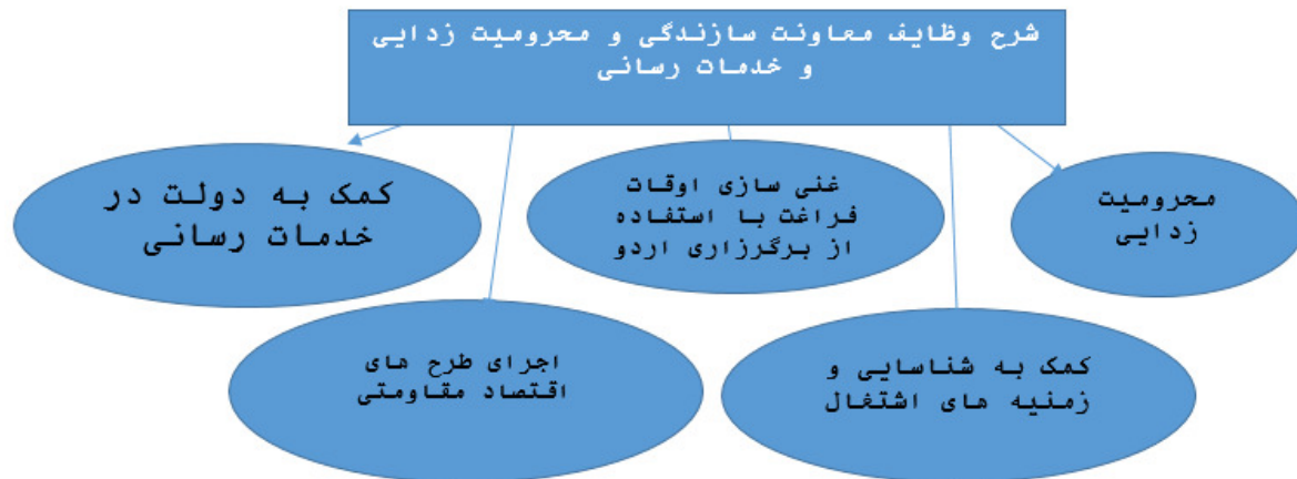
نقش و وظایف بسیج در محرومیت زدایی-بسیج سازندگی، نویسندهگان: ۱۳۹۷

پیچیده، به لحاظ سرزمینی گسترده و بانبروهای با انگیزه است. روش های سنتی در سازمان دهی و بکارگیری بسیج به منظور بهره‌برداری کامل از این ظرفیت الهی برای انقلاب اسلامی کافی نیست، روش های سنتی در بکارگیری سرمایه های فرهنگی - اسلامی مانع به فعلیت رسیدن این ظرفیت ها برای تغذیه فکری و رفع شبهه های توانمند سازی بسیجیان است، نخبگان باید به طور استراتژیک فکر کنند و برای یافتن مکانیسم هایی به منظور استفاده از شبکه های اجتماعی به نفع امنیت ملی و پیروزی اطلاعاتی تلاش متقاضی انجام دهد (خانیک، ۱۳۹۲: ۴۱۳) طرح سازندگی بسیج به منظور استفاده از نیروهای نشاط و جوانان برای سازندگی کشور در اوقات فراغت به درخواست اینجانب فراهم شده است، بسیج سازندگی خود ش یک شعبه کار عظیم است (طرح بسیج سازندگی با تدبیر مقام معظم رهبری در تاریخ ۷۹/۲/۱۷)