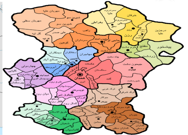
شکل شماره ۲-موقعیت جغرافیایی دهستان الوند غربی در شهرستان همدان