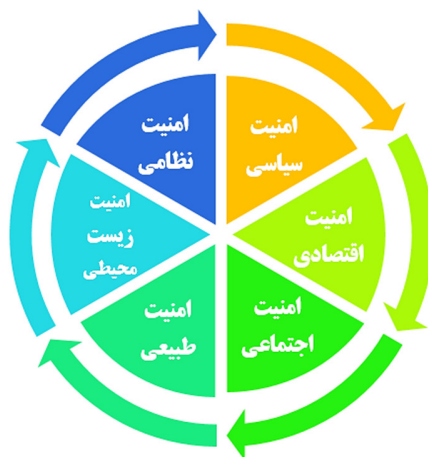
شکل ۱- ابعاد امنیت ملی (حافظ نیا، ۱۳۸۵: ۳۳۲-۳۳۰)

۵. حالتی که ملتی فارغ از تهدید از دست دادن تمام یا بخشی از جمعیت، دارایی یا خاک خود به سر برد.