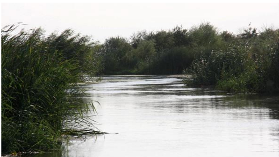
شکل (۱) جاذبه های طبیعی گردشگری منطقه مورد مطالعه

اندازه‌ای بی‌بدیل و چشم‌نواز، سال‌ها به خاطر مقررات خاص تردد در نواحی مرزی از دسترس همگان دورنگه داشته شده بود که باعث مسئولین برای گردشگران بازگشایی شد.