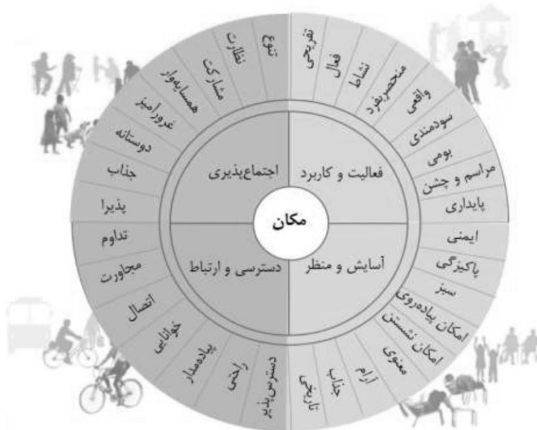
مدل مکان دیاگرام شکل ۱: