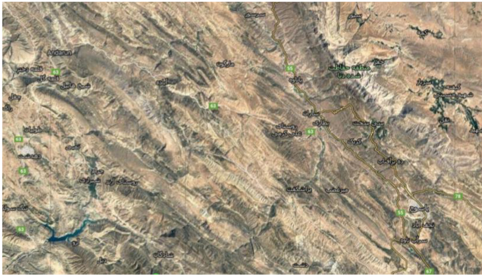
شکل (۲) عکس هوایی روستاهای منطقه مورد مطالعه