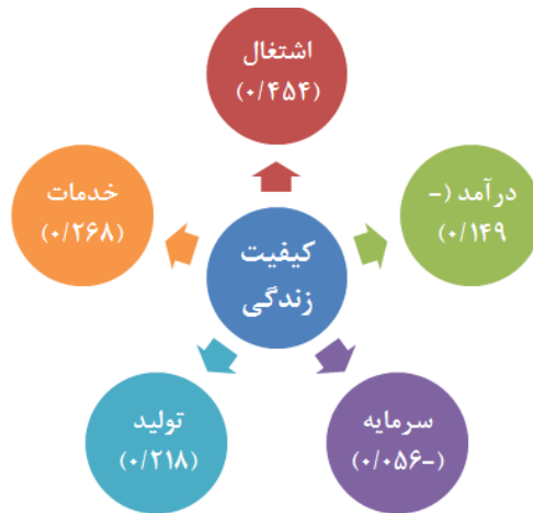
شکل (۲): اثرات کیفیت زندگی در اقتصاد شهری