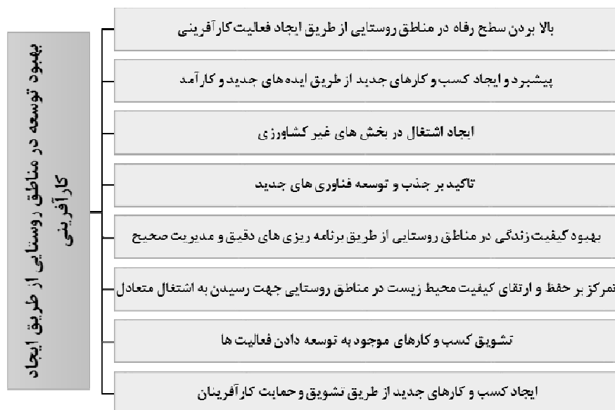
شکل شماره ۵: بهبود توسعه در مناطق روستایی از طریق ایجاد کارآفرینی

دنیای در حال تحول امروز، موفقیت را از آن جوامعی میداند که با ایجاد بسترهای لازم، منابع جامعه را به طور کارآمد با سرمایه‌گذاری مولد به سوی ایجاد ارزش افزوده و تسریع رشد و پیشرفت اقتصادی و افزایش ثروت جامعه، مدیریت و هدایت نماید. ضمن اینکه اگر بسترهای لازم منابع انسانی خود را به دانش و مهارت کارآفرینی مولد تجهیز کند تا آنها با استفاده از این توانمندی ارزشمند، سایر منابع را به سوی ایجاد ارزش و حصول رشد و توسعه، مدیریت و هدایت کنند، فرایند توسعه نیز تسهیل میگردد. این امر در روستاها از اهمیت ویژه‌ای برخوردار است. برنامه‌های توسعه با رویکرد کارآفرینی و در واقع به خدمت گرفتن کارآفرینی روستایی در راستای توسعه روستا، ابزار مهمی در جهت نیل به اهداف توسعه‌ای هستند و اگر به درستی طرح‌ریزی شوند، دستیابی به رشد و توسعه اقتصادی را تسهیل می‌کنند.