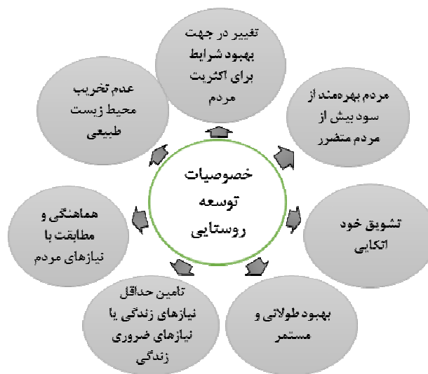
شکل ۳: خصوصیات و ویژگی‌های اصلی توسعه روستایی