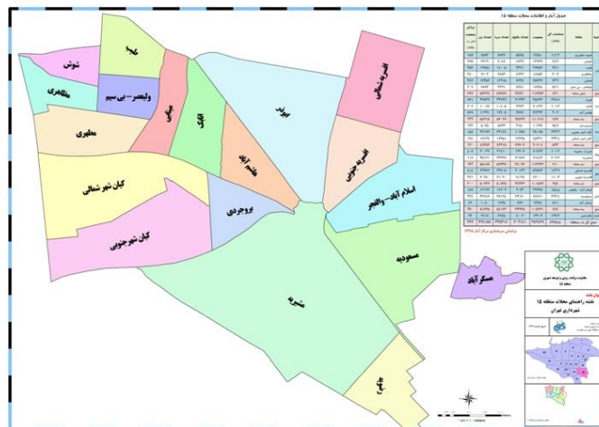
شکل (۱): محدوده منطقه مورد مطالعه

منطقه ۱۵ شهرداری تهران یکی از مناطق شهری تهران است که در جنوب شرقی شهر تهران قرار دارد. مهم ترین بخش آن شهرک های مشیریه و افسریه و بروجردی و سیزده آبان و بزرگراه های بسیج و بعثت و امام علی و آزادگان و خاوران است. شهرداری این منطقه در ضلع غربی پایانه اتوبوسرانی خاوران واقع گردیده است. جمعیت این منطقه براساس سرشماری سال ۱۳۹۰ ایران، ۶۳۸،۷۴۰ نفر (۱۹۲،۶۱۰ خانوار) شامل ۳۲۵،۳۱۳ مرد و ۳۱۳،۴۲۷ زن می باشد. با توجه به پر بودن بافت های شهری شکل گیری کانون مسکونی و عملکردی شبکه معابر و درجه بندی عملکردی آنها و سایر ویژگی های منطقه بکارگیری یک روش واحد محله بندی و تقسیم کالبدی منطقه به محله های دارای مرکزیت مکانی توجیه پذیر نیست.