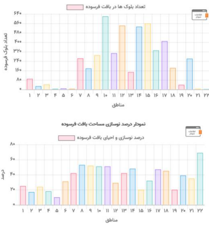
نمودار(۱): تعداد بلوک‌ها در بافت فرسوده مناطق ۲۲ گانه تهران

همان گونه که در تصویر فوق مشاهده می‌شود منطقه ۱۵ با ۲۶۶ هکتار بافت فرسوده در بین مناطق ۲۲ گانه شهر تهران در رتبه پنجم قرار دارد. این منطقه از لحاظ تعداد بلوک‌های فرسوده نیز در جایگاه دوم در بین مناطق شهر تهران قرار گرفته است. که این امر مدیران شهر را مستلزم به اجرای برنامه‌های کارآمد و مفید و پیشگیری در مقابل خطرات و سوانح و در وقوع بحران احتمالی در زمان‌های عاجل می‌سازد. اتابک، طیب و مینابی از جمله محلاتی هستند که بیشترین حجم بافت فرسوده منطقه ۱۵ را در خود جای داده‌اند.