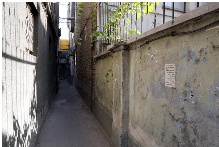
شکل (۳): تصویری از وضعیت نامطلوب زیستی، ساخت و ساز غیررسمی و آسیب پذیر در منطقه ۱۵

بنابر مطالعات انجام شده و تحلیل اطلاعات آماری و بررسی های میدانی چنین به نظر می رسد که محلات مختلف شهر این منطقه در وهله نخست به سبب ماهیت شکل گیری و توسعه شهری تفاوت چندانی از لحاظ دسته بندی محلات به سطوح مختلف ندارند با توجه به شاخص های مورد بررسی این منطقه نشان می دهد مساحت کل بافت فرسوده منطقه پانزده، ۲۴۶ هکتار است. مساحت بافت فرسوده نوسازی شده براساس تعداد پروانه های ساختمانی صادر شده در سال ۹۷ نیز کمتر از ۴ هکتار است. با این حساب تقریباً یک و نیم درصد از کل بافت فرسوده منطقه ۱۵ در سال قبل نوسازی شده است.