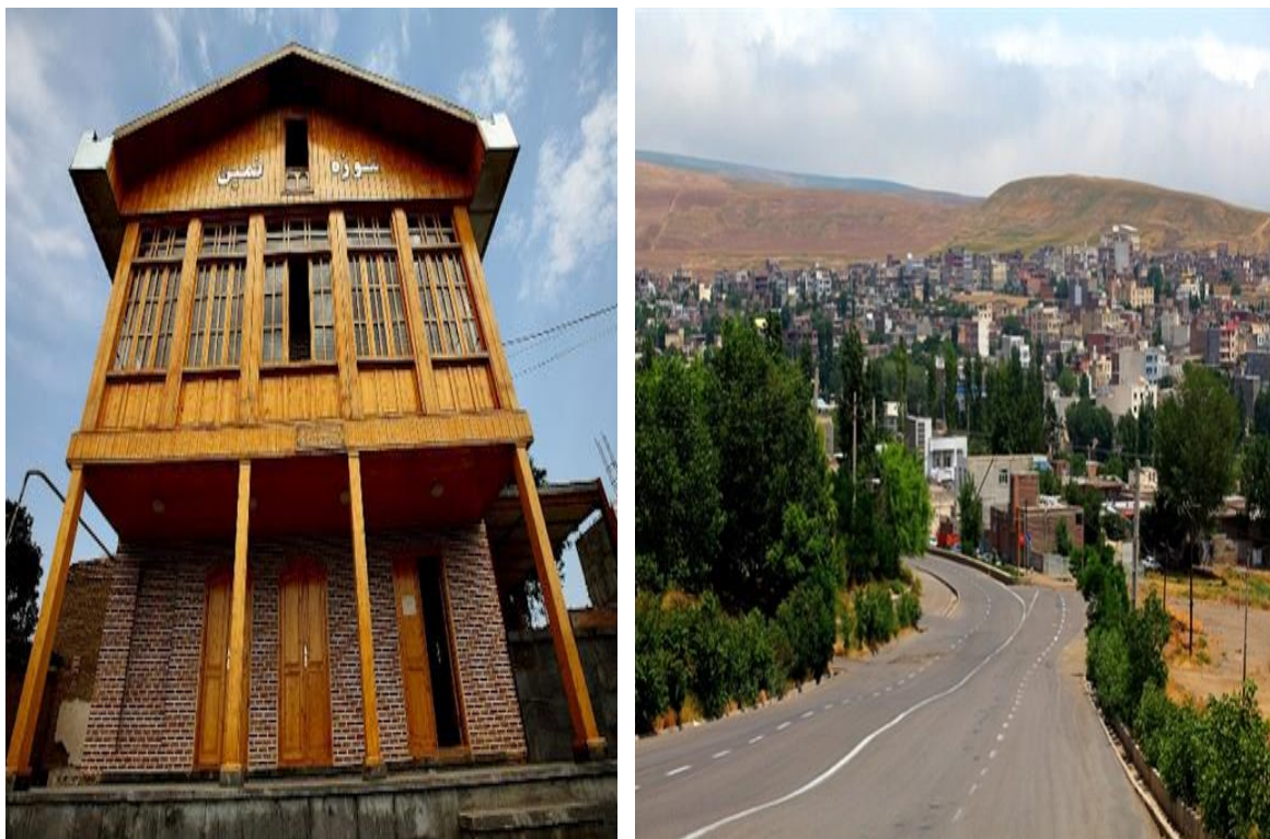
شکل ۳: نمایی از منطقه ژئوتوریستی نمین

منطقه گردشگری سرعین در شمال غرب ایران و در محدوده جغرافیایی ۴۷ درجه و ۴۸ دقیقه تا ۴۸ درجه و ۱۱ دقیقه طول شرقی و ۳۸ درجه و ۳ دقیقه تا ۳۸ درجه و ۱۵ دقیقه عرض شمالی قرار دارد. وسعت این شهرستان حدود ۳۷۳/۵۴۶ کیلومتر مربع است. سرعین یکی از شهرهای گردشگری استان اردبیل است. این شهر به علت چشمه‌های آبگرم معدنی شهرت جهانی دارد و یکی از مناطق گردشگری، تفریحی در استان اردبیل است. جلوه‌های خارق‌العاده طبیعت را میتوان در این شهر به وضوح دید. یکی از جاذبه‌های این شهر در فصل تابستان آب هوای بسیار دل‌پذیر شهر سرعین است که در وسط تابستان میتوان دمای هوای زیر ۱۵ درجه‌ای را تجربه کرد. یکی از نکات با اهمیت در سرعین، مدیریت بهره‌برداری مجتمع تجاری، آب درمانی و ... است که باعث شده به خصوص در زمستان شهر توریستی سرعین، مقصد هزاران گردشگر خارجی و ایرانی شده و مسافران معنای واقعی لذت طبیعت زمستانه کوه سبلان را با گرمای آبگرم معدنی گاومیش گلی را تجربه می‌کنند. (شکل ۴).