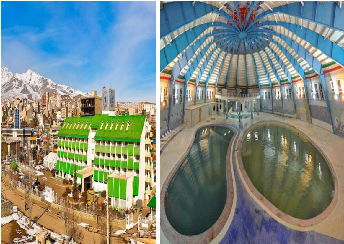
شکل ۴: نمایی از منطقه گردشگری سرعین