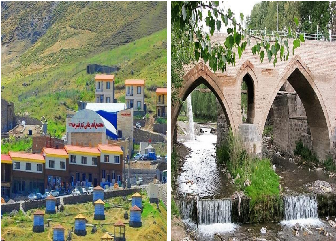
شکل ۲: نمایی از منطقه ژئوتوریستی نیر

منطقه ژئوتوریستی نمین: نمین در منطقه‌ای کوهستانی و در حاشیه دریای دریاچه خزر، با ارتفاع ۱۷۰۰ متر از سطح دریا در استان اردبیل قرار دارد. نمین دارای آب و هوایی معتدل، زمستان‌هایی سرد و تابستان‌هایی ملایم است. این شهر با فرهنگ غنی از هنر و موسیقی پیشتاز در عرصه ی فرهنگ می‌باشد. نمین دارای جنگل‌های طبیعی فندق، ازگیل، زالزالک، تمشک و باغ‌های میوه فراوان است. فاصله نمین از اردبیل ۲۵ کیلومتر بوده و از سویی دیگر پس از عبور از گردنه حیران به شهر ساحلی آستارا می‌رسد. نمین از دیرباز به داشتن فرهنگی غنی معروف است. طبق سرشماری سال ۱۳۹۵ در مجموع جمعیت این شهر نزدیک به ۹۶۴۵۷ نفر است. شکل (۳).