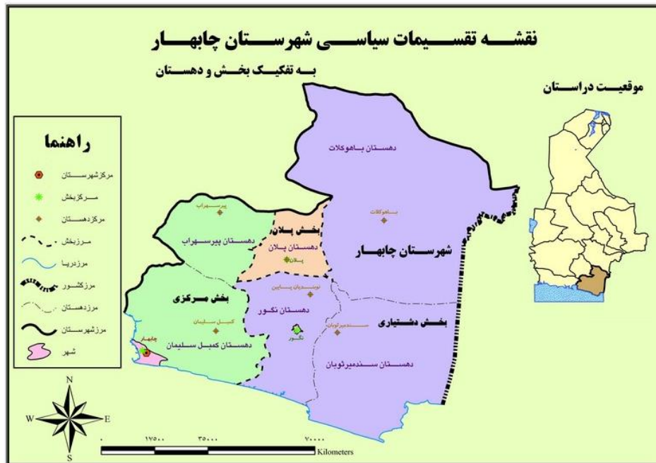
شکل شماره (۱) نقشه محدوده مورد مطالعه

راس‌السرطان و قرارگرفتن در مسیر بادهای موسمی شبه قاره هند و جبهه‌های استوایی باعث شده که این منطقه آب و هوایی گرمسیری، معتدل و یا رطوبت نسبی داشته باشد. بندر چابهار به دلیل موقعیت راهبردی، که نزدیک‌ترین راه دسترسی کشورهای محصور در خشکی آسیای میانه (افغانستان، ترکمنستان، ازبکستان، تاجیکستان، قرقیزستان و قزاقستان) به آب‌های آزاد است از اهمیت فراوانی برخوردار است و سازندگی و سرمایه‌گذاری فراوانی در آن صورت می‌گیرد؛ از جمله ساخت اسکله و افزایش گنجایش بارگیری کشتی‌های اقیانوس‌پیما (در خلیج چابهار) و ساخت راه‌آهن به سوی آسیای میانه و احداث فرودگاه بین‌المللی. این بندر یکی از مهم‌ترین چهارراه‌های کریدور شمال- جنوب بازرگانی جهانی است.