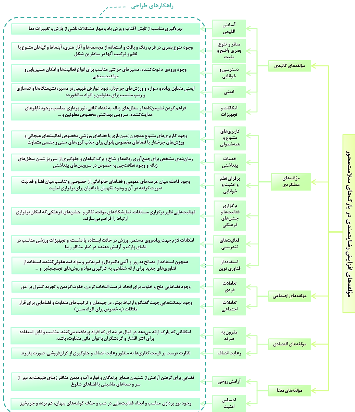
نمودار ۲. مؤلفه‌های مؤثر در افزایش رضایتمندی و سلامتی گردشگران از پارک‌های تفریحی (مأخذ: نگارندگان)

صرفه بودن و رعایت انصاف و «معنایی» با شاخص آرامش روحی و احساس امنیت در این نمودار طبقه‌بندی گردیدند و راهکارهای طراحی جهت افزایش بهره‌وری برای هر شاخصه عنوان شده‌است.