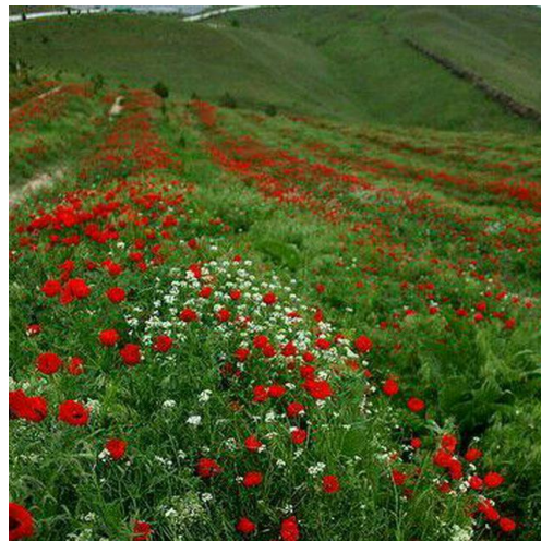
تصویر ۳: طبیعت بکر و گیاهان دارویی محمودآباد