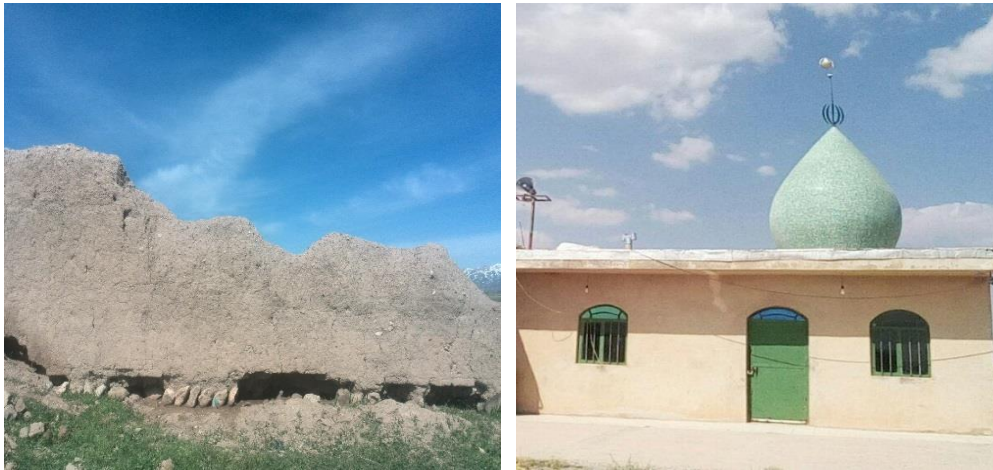
تصویر ۴: اماکن متبرکه (مقبره سید اسداله موسوی) و بقایای قلعه باستانی