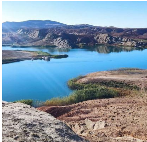
تصویر ۲: سد خاکی محمودآباد