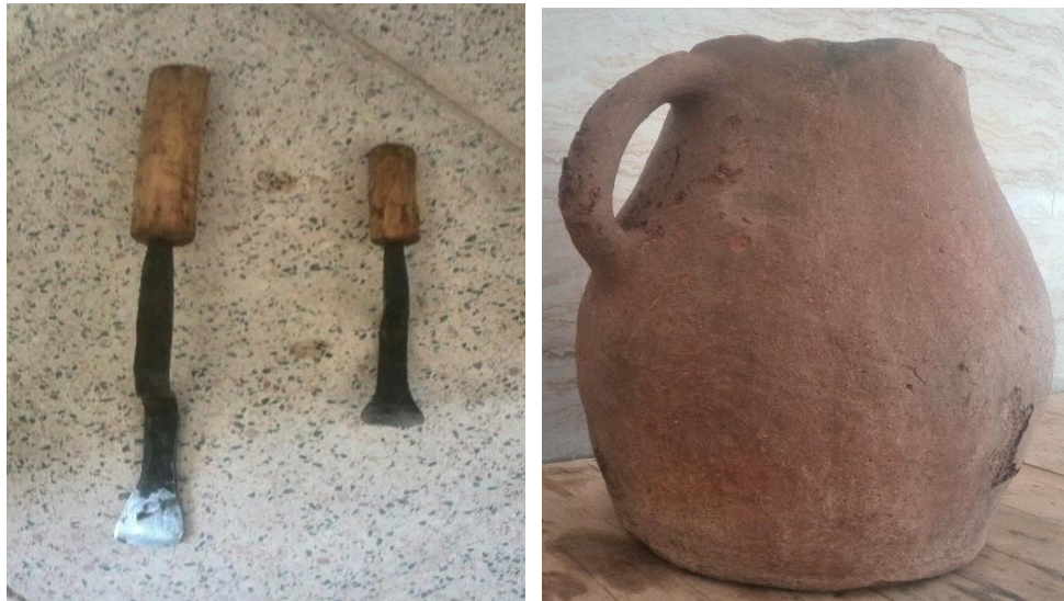
تصویر ۵: صنایع دستی محمودآباد