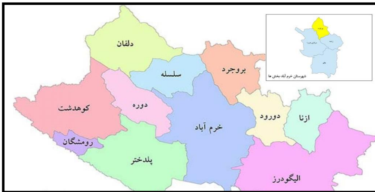
شکل ۱: موقعیت مکانی شهرستان خرم آباد