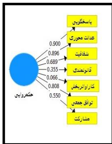
شکل ۲- بار عاملی و میزان خطای مدل اندازه گیری بعد حکمروایی خوب

و پایین ترین سهم و نقش (بار عاملی) را در اندازه گیری متغیر(عامل) حکمروایی خوب در توسعه کالبدی به خود اختصاص داده است.