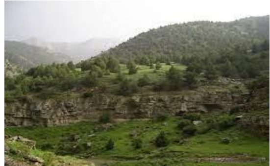
شکل ۵) جنگل‌های نادر ارس