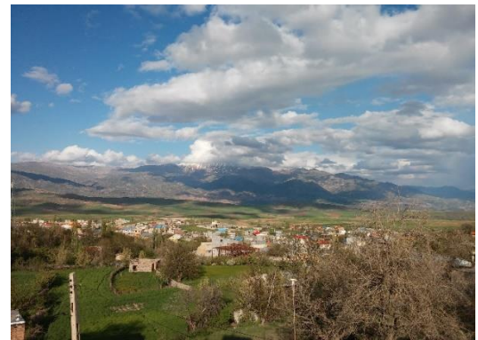
شکل ۲) نمایی زیبا از شهر هشجین