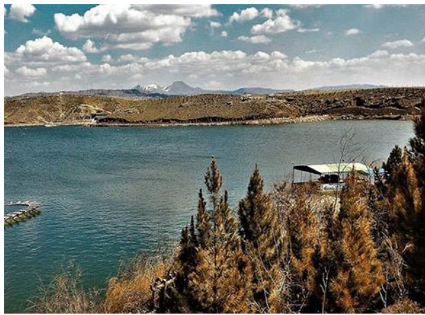
شکل ۲: تصویر منطقه شبستر