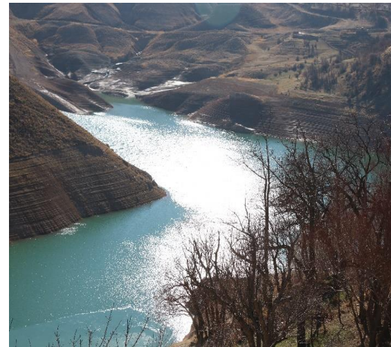
شکل (۷) سد زنوز