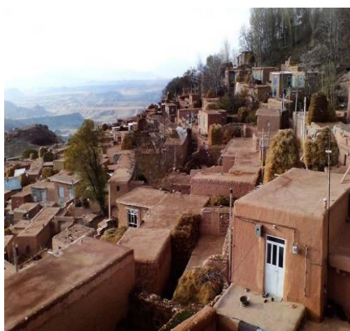
شکل (۳) مناطق ژئوتوریستی زنوزق