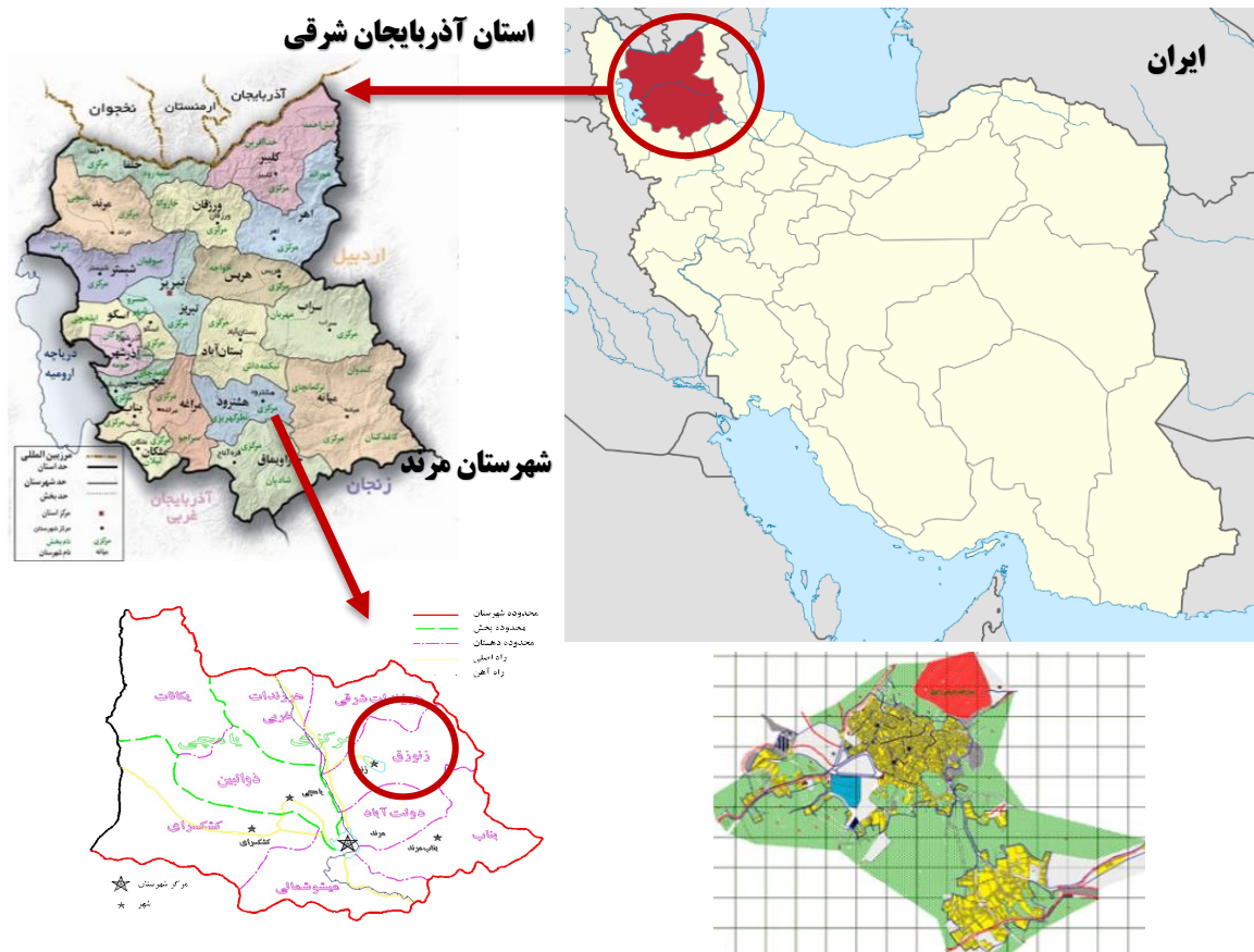
شکل (۱) موقعیت جغرافیایی منطقه مورد مطالعه