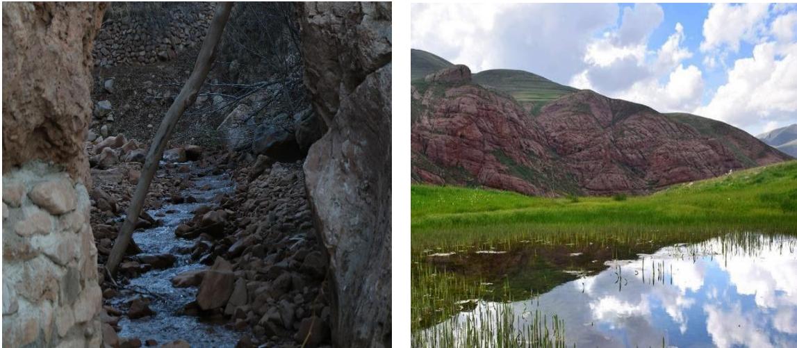
شکل ۸ چشمه‌های زَنوزق

چشمه های زَنوزق: اسم اصلی روستا زَنوز داغ بوده است که در زبان عامیانه به زَنوزق تبدیل شده است. زَنوز داغ یعنی زَنوزی که در پای کوه قرار دارد. خود کلمه زَنوز هم از دو کلمه زُن و اوز به معنی چشمه‌ها تشکیل شده است. در واقع معنی لغت به لغت این روستا می‌شود: شهر چشمه‌ها در پای کوه. یکی از مهم‌ترین چشمه‌های این روستا چشمه کلیستر، منبع تامین آب کشاورزی روستا است. اطراف این چشمه بعنوان منطقه ژئوتوریستی معرفی میگردد که بدنبال جذب گردشگر و توانمندی این روستا به حساب می‌آید. شکل (۸)