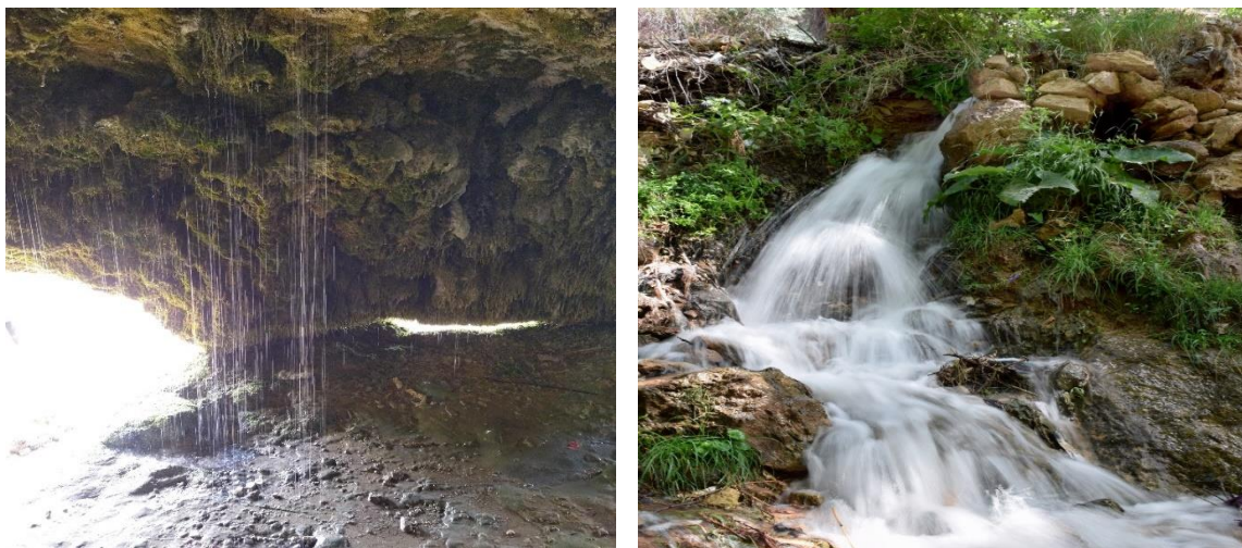
شکل (۵) آبشار دامجی قیه

مناطق ییلاقی (ییلاق ماهاری): این منطقه مکانی مناسب برای گردش و تفریح گردشگران محسوب می‌گردد. دشتی سرسبز پر از سبزی‌های خوراکی و دارویی که گیاهانی مثل سبزی‌های کوهی، سیر وحشی، چیچک، غاز یاقی و انواع گل‌های وحشی در این دشت زیبا پیدا می‌شوند. گروهی از مسافرت‌ها با هدف تامین بهداشت و سلامت فرد یا گردشگر انجام می‌شود مانند مراقبت بهداشتی و گذراندن دوره نقاهت و بازپروری. گردشگری سلامت را می‌توان به دسته گردشگری تندرستی، گردشگری درمانی، گردشگری پزشکی تقسیم بندی نمود. از دیدی دیگر می‌توان گردشگری سلامت را دارای