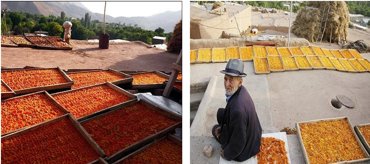
شکل (۴) پشت بام نارنجی

پشت بام ها نارنجی: در این روستا در فصل تابستان پشت بام ها پوشیده از قاب های چوبی نارنجی رنگ زردآلو هستند. که در فصل تابستان خشک می گردند و در فصل زمستان مصرف می شوند. این ویژگی در این دهستان باعث افزایش میزان گردشگر و جذب مسافر می گردد. (شکل ۴)