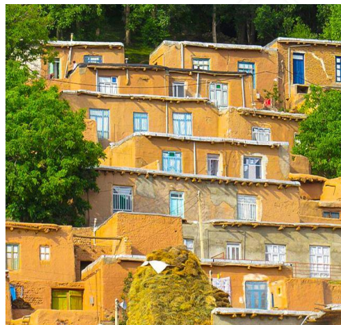
شکل (۲) تصویر منطقه مورد مطالعه