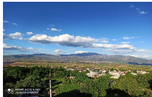
نمایی زیبای شهر هشجین