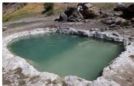
ابگرم زاویه جعفرآباد