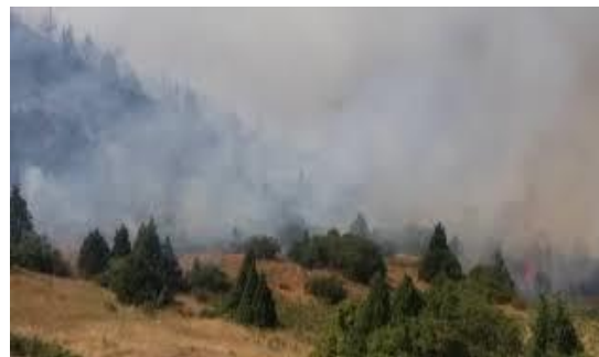
جنگل های ارس