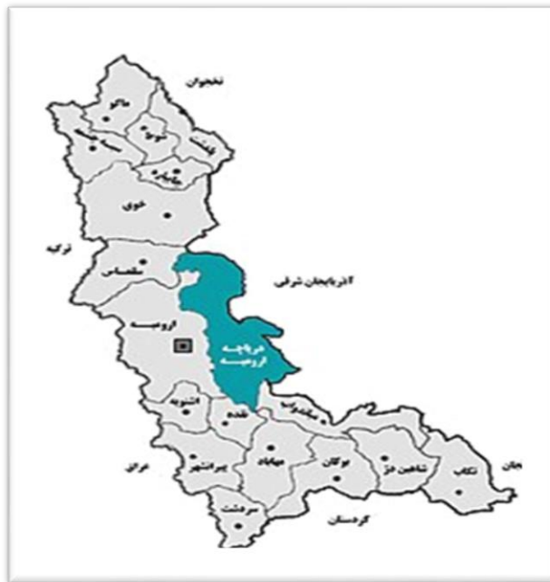
شکل ۱. موقعیت جغرافیایی روستاهای مورد مطالعه استان آذربایجان غربی

از نظر جاذبه های گردشگری، روستاهای مورد مطالعه، دارای منابع و جاذبه های گردشگری متعددی می باشند. جداول (۱) الی (۴) مهم ترین منابع و جاذبه های گردشگری را در روستاهای مورد مطالعه نشان می دهند.