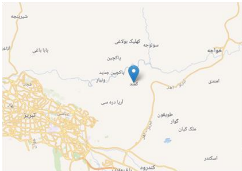
شکل ۱. موقعیت منطقه مورد مطالعه

قلمرو جغرافیایی تحقیق حاضر روستای گمند شهرستان هریس می‌باشد. روستای گمند در ۶۵ کیلومتری جنوب غربی هریس و ۱۵ کیلومتری جنوب غربی خواجه و در ۱۰ کیلومتری شرق تبریز در حاشیه جاده تبریز اهر قرار دارد. این روستا از شمال به روستاهای گوگرچین و سولوجه، از شرق به روستاهای طویقون، از غرب به روستای ونیار و از جنوب به روستای آریادره سی محدود می‌شود. نزدیک‌ترین روستا به روستای گمند روستای طویقون در ۵ کیلومتری روستا می‌باشد. نزدیکی روستا به شهر تبریز باعث شده است مردم روستا برای انجام بیشتر امور خود به شهر تبریز مراجعه کنند. این روستا در منطقه کوهستانی و در موقعیت دره‌ای قرار گرفته است و شکل استقرار روستا به شکل متراکم می‌باشد و به علت واقع شدن در یک منطقه کوهستانی و بیلاقی دارای آب و هوایی معتدل در تابستان‌ها و سرد در زمستان‌ها است. در آخرین سرشماری عمومی نفوس و مسکن کشور که در سال ۱۳۹۵ انجام شده است، جمعیت روستای گمند برابر ۸۹۱ نفر اعلام شده است که در قالب ۲۵۱ خانوار در روستا سکونت دارند.