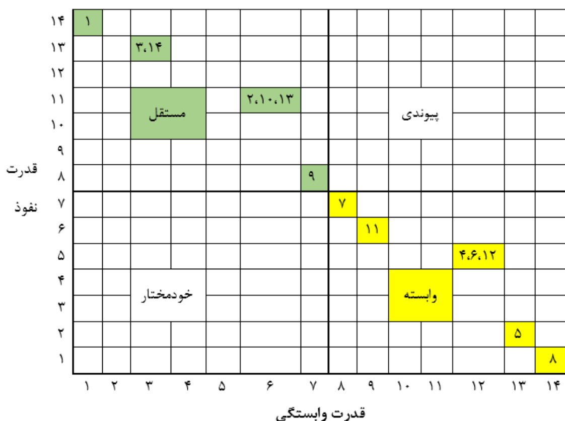
شکل ۲- خوشه‌بندی فاکتورها به روش تحلیل میک ماک

در این مرحله با استفاده از محاسبه قدرت فاکتور (نفوذ) و وابستگی فاکتورها، نمودار قدرت نفوذ-وابستگی ترسیم می‌شود. همان‌طور که در جدول ۴ مشاهده می‌شود، از طریق جمع‌کردن ورودی‌های "۱" در هر سطر و ستون قدرت نفوذ و میزان وابستگی متغیرها به دست می‌آید. در جدول ۵، درجه قدرت نفوذ و وابستگی متغیرها نشان داده شده است.