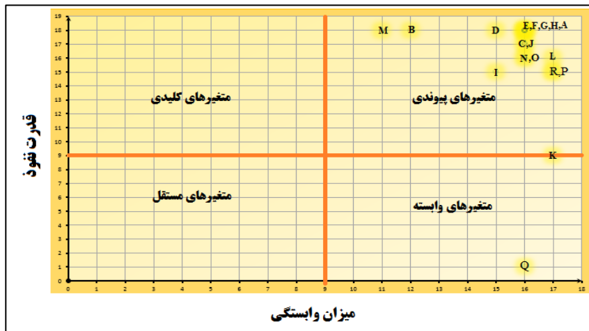
شکل ۴. نمودار سطح بندی موانع مؤثر بر توسعه گردشگری اسب در استان خوزستان با استفاده از روش MICMAC