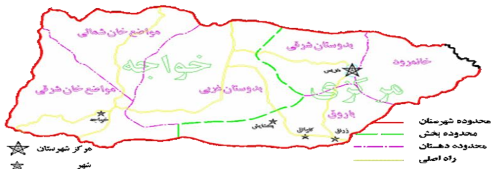
شکل ۲: نقشه شهرستان هریس

شهرستان هریس یکی از شهرستان‌های استان آذربایجان شرقی است که از دو بخش مرکزی و خواجه تشکیل شده است و با وسعت ۲۳۴۵ کیلومتر مربع در ۶۰ کیلومتری تبریز واقع شده است. جمعیت این شهرستان طبق سرشماری سال ۱۳۹۵ بالغ بر ۶۹۰۹۳ نفر است. مرکز این شهرستان، شهر هریس می‌باشد. شهرستان هریس از سمت شرق به شهرستان‌های سراب و مشگین شهر، از سمت غرب به شهرستان تبریز، از سمت شمال به شهرستان‌های ورزقان و از سمت جنوب به شهرستان بستان‌آباد محدود شده است. از نقاط دیدنی این شهرستان می‌توان به آب معدنی اکوزداغی، امامزاده ابواسحاق، دربند هرزه ورز، میدان قلعه‌بوری، چشمه سوقالخان، منطقه گردشگری سابلاق، تپه دوزده باغیرزنق، گورستان مینق، سد پارام، سد ارباطان و روس قلعه‌سی، پل تاریخی و نیار، برج دیده‌بانی بخشایش اشاره کرد. نیروگاه سیکل ترکیبی هریس از منابع انرژی در این منطقه است. مرغوب‌ترین و معروفترین فرش پشمی آذربایجان در شهرستان هریس بافته می‌شود در چند سال اخیر جاده جدیدی ۵ کیلومتر بعد از خواجه راه اصلی اهر-تبریز را به هریس متصل می‌کند جاده قدیمی نیز کماکان دایر است فاصله هریس تا تبریز حدود ۶۷ کیلومتر است.