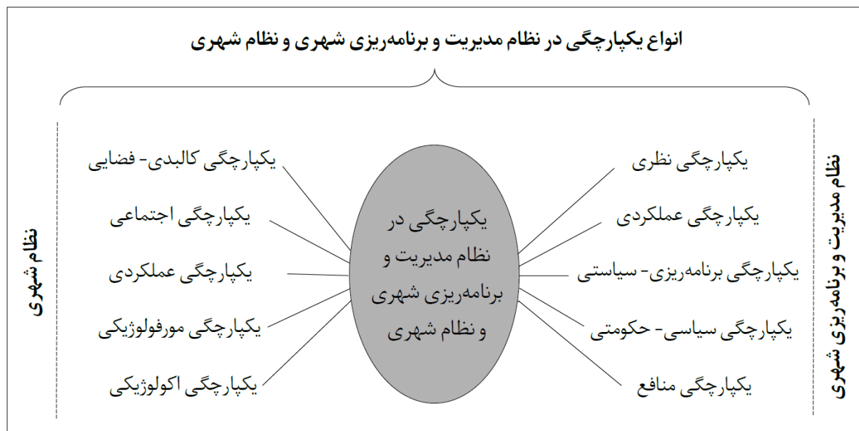
شکل ۱- یکپارچگی در نظام مدیریت و برنامه‌ریزی شهری و نظام شهری

یکپارچه‌سازی نظام مدیریت و برنامه‌ریزی شهری، یکپارچه‌سازی نظام شهری را در ابعاد مختلف به‌دنبال دارد (قالیباف و همکاران، ۱۳۹۲: ۵۵). شکل ۱، یکپارچگی در نظام مدیریت و برنامه‌ریزی شهری و نظام شهری را نمایش می‌دهد.