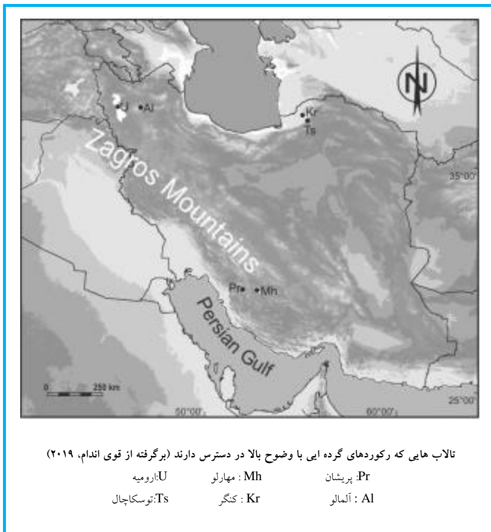
شکل ۱. نقشه پراکندگی رکوردهای گرده ایی

ارتباط یخبندان کامل اروپا همزمان با بارش گرده فلات استپ شمال غرب ایران است. این نشان داد که در آن زمان آب و هوا در منطقه زریبار خشک تر و همچنین خنک تر از امروز بود (ون زایست، ۱۹۶۷). بارش گرده های گیاهی در بازسازی تاریخچه پوشش گیاهی و آب و هوای گذشته منطقه خاورمیانه می تواند مفید باشد (دجملی و همکاران، ۲۰۰۹). مقایسه رکورد گرده ایی زریبار با مکان هایی در یونان، جنوب غربی ترکیه و غرب سوریه نشان می دهد که آب و هوای یخبندان قاره ای غربی ایران باید نسبت به نواحی نزدیک سواحل مدیترانه برای رشد درختان نامطلوب تر بوده باشد (ون زایست، ۱۹۷۷). پژوهش لروی و همکاران (۲۰۱۱) دو تالاب مهم بین المللی رامسر