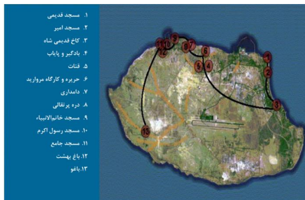
تصویر ۲- فرهنگ و میراث جزیره کیش (همان)