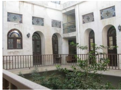
تصویر شماره ۶- شناشیر بدون سقف (شرقی،