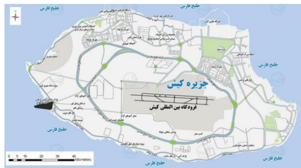
تصویر ۱- موقعیت جزیره کیش

جزیره کیش بخشی از شهرستان بندر لنگه با ۹۰/۴۵۷ کیلومتر مربع مساحت در شمال شرقی خلیج فارس و در جهت غربی- شرقی در فاصله حدود ۲۰ کیلومتری کرانه های جنوبی ایران بین ۲۶ درجه و ۳۳ دقیقه و ۱۵ ثانیه عرض شمالی و ۵۴ درجه و ۱ دقیقه و ۳۰ ثانیه طول شرقی نسبت به نصف النهار گرینویچ واقع شده است. (رحیمی فرزاد، ۱۳۶۹، ۳) جزیره کیش به واسطه موقعیت جغرافیایی و منظره طبیعی بی نظیر از موقعیت ویژه ای برخوردار است. به گونه ای که دارای توان بالقوه ای برای فعالیت های جهانگردی است. طول جزیره کیش در جهت غربی- شرقی ۱۵ کیلومتر و پهنای آن در جهت شمالی- جنوبی ۷ کیلومتر و تقریباً بیضوی شکل می باشد. بلندترین نقطه جزیره که در محل شرقی جزیره قرار دارد، که حدود ۴۵ متر از سطح دریا ارتفاع دارد و ارتفاع متوسط این جزیره از سطح دریا حدود ۳۲ متر است. (افشار سیستانی، ۱۳۷۰، ۴۴)