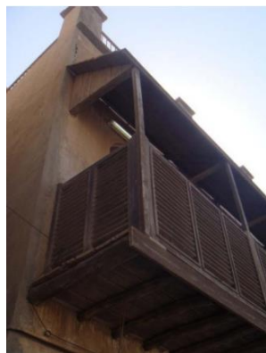
تصویر شماره ۵- شناشیر در بوشهر (شرقی، نادومی، ۲۰۱۹، ۲۰۷)

شناشیر: در معماری بومی سواحل خلیج فارس از عنصری به نام شناشیر استفاده می شود. شناشیر گونه ای تراس چوبی است که به سبب تنوع شیوه ساخت آن، نماهای متنوعی پدید می آید. (کشکوک، ۱۳۸۴) شناشیر را می توان تلاش فضای خصوصی جهت استفاده بیشتر از جریان باد در فضای عمومی دانست. شناشیر در هم تنیدگی پیوسته فضاهای عمومی و خصوصی به منظور استفاده مطلوب از جریان باد است (رنجبر، ۱۳۸۹) این عنصر نور و هوا را به فضای داخلی هدایت می کند به گونه ای که نمی توان از فضای بیرونی به فضای درونی نگریت. (حمیدی، ۱۳۹۱) در طراحی این عنصر از نرده های مشبک پوشیده به جهت استفاده از جریان هوا و ایجاد سایه استفاده می شود. (شاطریان، ۱۳۹۰، ۳۹۲)