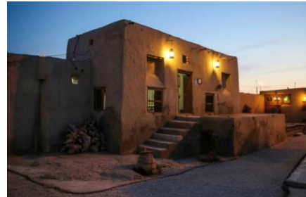
تصویر شماره ۳- خانه بومیان کیش (اسپندانی، ۱۳۷۸، ۹۴)

بررسی معماری بومی جزیره کیش بیانگر این است که جهت گیری ساختمان ها در این جزیره از جهت عمومی وزش باد غالب جزیره یعنی غربی - شرقی پیروی می کند. همچنین بررسی وضعیت باد غالب منطقه نشان می دهد که متوسط سرعت باد غربی ۵/۵ متر در ثانیه بوده و سرعت باد شرقی و غربی هیچگاه از ۴/۵ متر در ثانیه کمتر نیست. تحلیل فراوانی باد و اثرات ناشی از آن بر شرایط آسایش نشان می دهد که در ۷۵ درصد از طول سال می توان شرایط آسایش را با استفاده از باد تأمین کرد که این میزان برای فصول گرم به ۴۱ درصد می رسد. به این معنی که در ۴۱ درصد از طول فصل گرم شرایط آسایشی توسط مکانیزم باد قابل تأمین است. (همان)