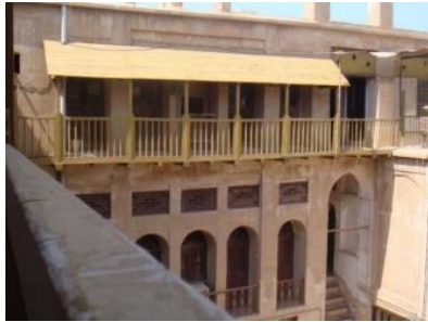
تصویر شماره ۷- شناشیر مسقف (همان)

پوشش شناشیر به دو صورت مسقف و بی سقف است. در شناشیر مسقف پوشش بر روی ستون های با قطر کم و چهار تراش تکیه کرده است. پوشش چوبی یا به صورت پیوسته بر روی کل آن می باشد و یا به شکل غیر پیوسته و فقط بر روی بازوهای اتاق قرار گرفته است (معماریان، ۱۳۸۴، ۱۰۰).