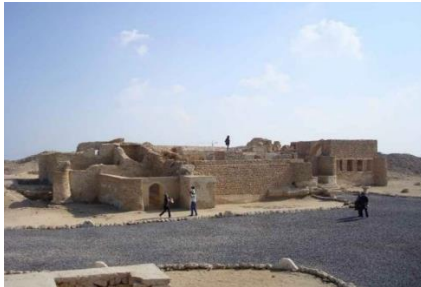
تصویر شماره ۴- شهر حریره کیش (همان)

استفاده می شده است و امروزه استفاده از چوب های چهار تراشی به نام کرن، که از دبی وارد می شود، متداول است. (اسپندانی، ۱۳۷۸، ۹۴)