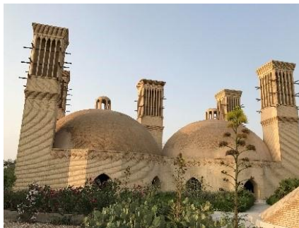
تصویر شماره ۸- بادگیرهای آب انبار جزیره کیش

مکیدن هوا می کنند. در همین زمان در جهت دیگر به عنوان سیستم مکش و خروجی عمل می کنند. بررسی در زمینه ی چگونگی تهویه ی طبیعی ساختمان ها نشان می دهد که فضای گشودگی های ورودی و خروجی بادگیر ۰۵-۰۳٪ فضای کف را تشکیل می دهند. در مواقعی که هیچ گونه بادی در کار نیست هرگونه بادگیر به عنوان دستگاه تهویه عمل می نماید. به گونه ای که بر اثر فشار کمتر هوای بیرونی از فشار هوای درون ساختمان هوای گرم بوسیله ی اثر دودکشی به بیرون کشیده می شود. بنابراین همواره یک جریان هوا در درون فضا برقرار می گردد، هرچند که شدت آن کمتر از مواقعی خواهد بود که باد در محیط خارج جریان داشته باشد. (فاروقی، ۱۳۹۴، ۸)