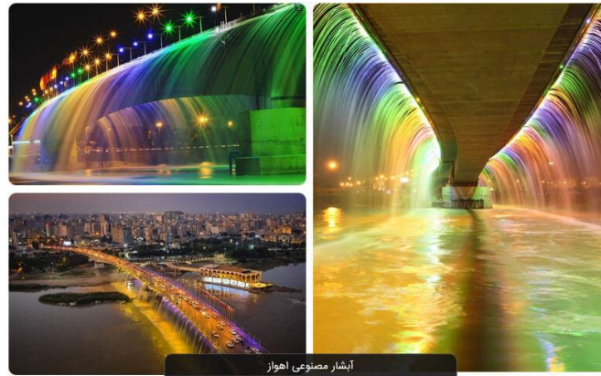
شکل ۴- آبشار مصنوعی

جدول ۱- چابوب توسعه گردشگری شهری برای ارتقا درآمدهای پایدار در پرتو حکمروایی خوب (مورد استفاده پژوهش)