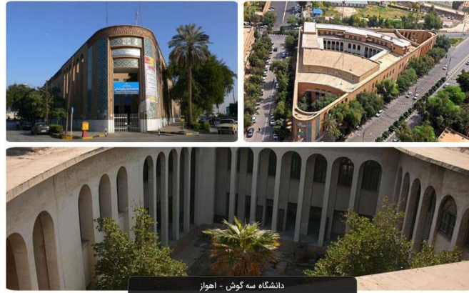
شکل ۲- ساختمان سه گوش