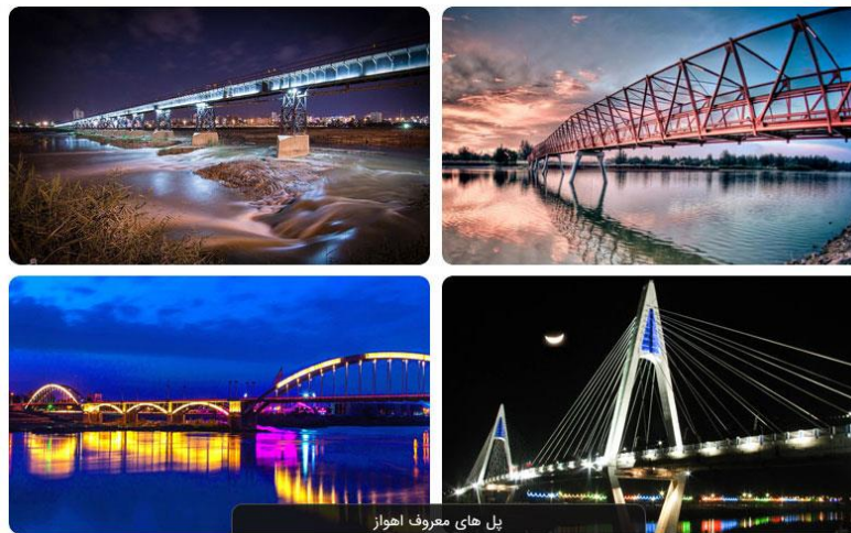
شکل ۳- پل های معروف اهواز

رود کارون به عنوان پرآب ترین و بزرگ ترین رود ایران از میان شهر اهواز عبور می کند که بر روی آن ۸ پل ساخته و مشهور گشته است. پل های اهواز با معماری خاص و منحصر به فرد خود یک جاذبه گردشگری به شمار می روند و فضای شهر را زیبا کرده اند،