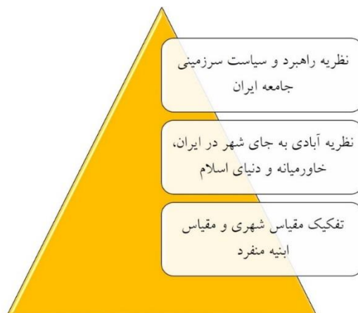
شکل ۳: نمودار نظریات پیران در خصوص شهر، جامعه و تاریخ ایران