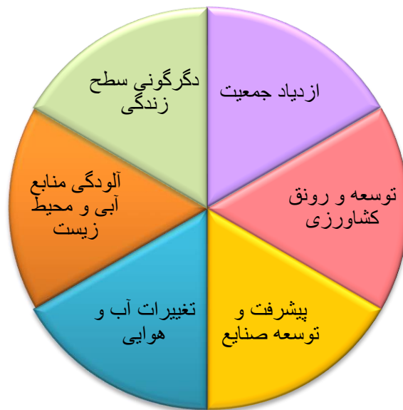
شکل (۲): عواملی که بیشترین تاثیر را بر مدیریت منابع آب خواهند داشت (نبی افجدی و همکاران، ۱۳۹۳، ۶۲)