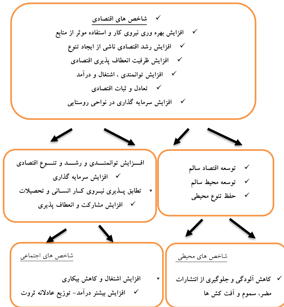
شکل شماره: ۳ ارتباط درون شاخص‌های پایداری اقتصادی سکونتگاه‌های روستایی