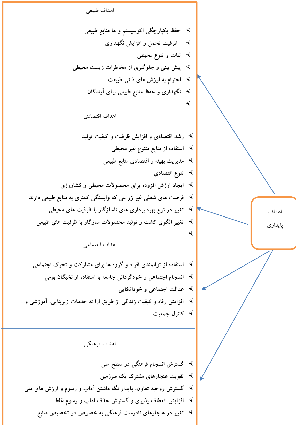
شکل شماره: ۲ اهداف پایداری در توسعه روستایی

نابرابری‌ها و موانع موجود در مسیر توسعه صنعتی نیز احساس می‌شود. این مطالعه می‌تواند به توسعه راهکارهایی برای تحقق توسعه پایدار و بهبود کیفیت زندگی در مناطق روستایی کمک کند.