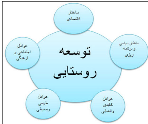
شکل ۱. دیاگرام مدل مفهومی توسعه روستایی