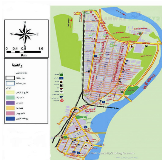
شکل (۲): موقعیت کاربری اراضی و نواحی منطقه ۲ کلانشهر اهواز