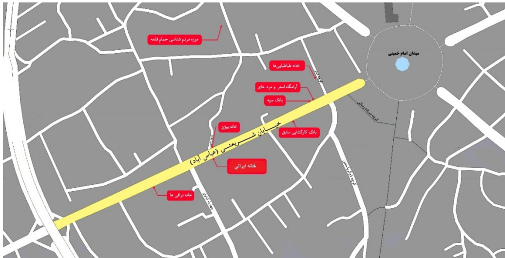
شکل ۲- جانمایی بناهای معرفی شده در تحقیق

در نهایت تبدیل شدن این خیابان به یک مسیر فرهنگی منجر به موارد زیر میگردد: