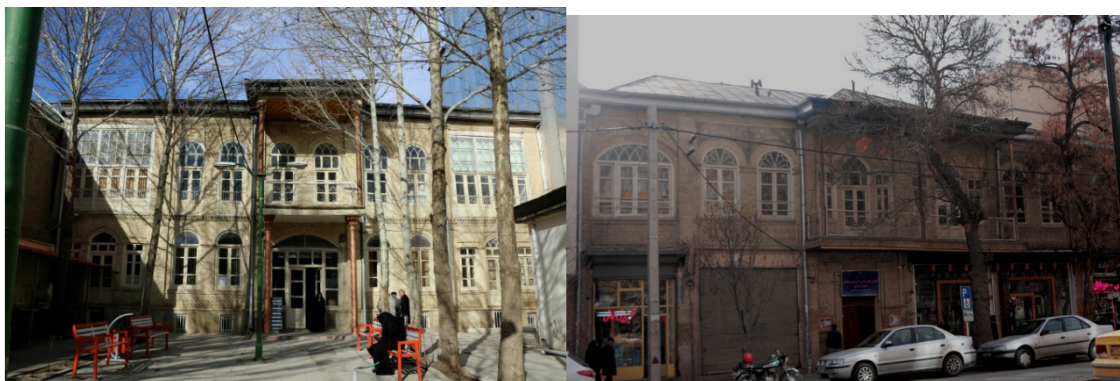
عکس ۲ نمای بیرونی خانه ایرانی از خیابان و حیاط

این بنا در خیابان شریعتی واقع شده دارای معماری منحصر با مساحت ۶۰۰ متر مربع و در دو طبقه و یک زیر زمین است. بنای ساختمان نزدیک به صد سال سابقه ساخت دارد. گفته می شود این بنا ابتدا خانه مسکونی حاج شیخ تقی ایرانی (وکیل الرعایا)، تاجر سرشناس و نماینده همدان در دوره اول و دوم شورای ملی، بوده است. طی سالهای اخیر اتاقهای طبقه همکف این ساختمان در اختیار کانون بازنشستگان آموزش و پرورش قرار داشت. مدیران ناحیه یک آموزش و پرورش در زمان دولت پیشین در نظر داشتند بنای جدیدی با وسعت زیاد و سبک جدید بنا کنند که کانون با تخریب آن مخالفت کرد داستان را به میراث فرهنگی اطلاع داد و میراث فرهنگی در سالهای اخیر آن را جزئی از آثار فرهنگی شناخت و برای بازسازی بنا اقدام کرد. این بنا به نام مدرسه آزاد در تاریخ ۷ اسفند ۱۳۸۶ و به شماره ۲۱۶۲۸ ثبت ملی شده است. به تازگی مدرسه‌ای که در طبقه بالای کانون بازنشستگان آموزش و پرورش همدان قرار داشت به دستور اداره آموزش و پرورش تخلیه شده است.