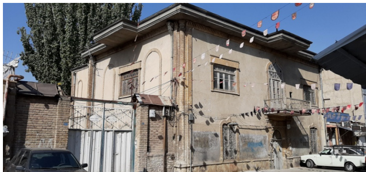
عکس ۴ نمای بیرونی خانه طباطبایی

خانه طباطبایی‌ها متعلق به خاندان طباطبایی که ملقب به رئیس الاسلام بود و مربوط به اواخر دوره قاجار است. متراژ بنا حدود ۲۴۰ متر و با زیر بنای ۲۸۸ متر در سه طبقه زیر زمین و زمین و همکف قرار دارد. سید محمد طباطبایی ملقب به رئیس الاسلام که نماینده مردم همدان در مجلس شورای ملی بود در این خانه ساکن بود و بسیاری از رهبران و فعالان جنبش مشروطه در زمان قاجار در این خانه رفت و آمد داشتند. گفته می‌شود این بنا در دوره پهلوی اول به عنوان بانک المانی‌ها و دفتر بیمه انگلسترخ انگلستان مورد استفاده قرار می‌گرفته است و پس از آن مورد استفاده سازمان اطلاعات و امنیت کشور مشهور به ساواک بوده است. بعد از انقلاب سه بار خرید و فروش شده است و هم اکنون دو مالک دارد. این خانه به ثبت آثار ملی درنیامده است.