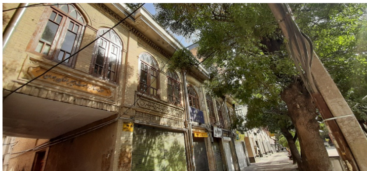
عکس ۳ نمای بیرونی خانه بیژن

بیژن نقاش برجسته دوره قاجار است که تا سال‌های نخست دوره پهلوی اول در شهر همدان میزیست. وی یکی از همکاران کارل فریش در طراحی نقشه میدان اصلی شهر همدان بوده است. خانه‌ای که بیژن در آن سکونت داشت نمونه‌ای برجسته از معماری نوین است که او به کمک کارل فریش آلمانی طراحی کرد و با دقت و ریزه‌کاری بسیار ساخت. آنچه امروز از خانه بیژن مانده تنها بخش کوچکی از آن بنا است. موزه مفاخر و مشاهیر همدان از جمله موزه‌های استان همدان بود که در سال ۱۳۸۸ خورشیدی در محل خانه بیژن راه اندازی شده، پس آن با عنوان خانه صنایع دستی توسط میراث فعالیت داشت و امروز به عنوان بنیاد ایران شناسی زیر نظر سازمان میراث فرهنگی استفاده می‌شود. زیربنای فعلی خانه بیژن حدود ۲۲۰ مترمربع دارای دو طبقه است بخشی از این خانه به ویژه در ورودی اصلی آن، به واحد تجاری تبدیل شده است. این اثر در تاریخ ۲۵ اسفند ۱۳۸۰ با شماره ثبت ۵۰۲۲ به عنوان یکی از آثار ملی ایران به ثبت رسیده است.